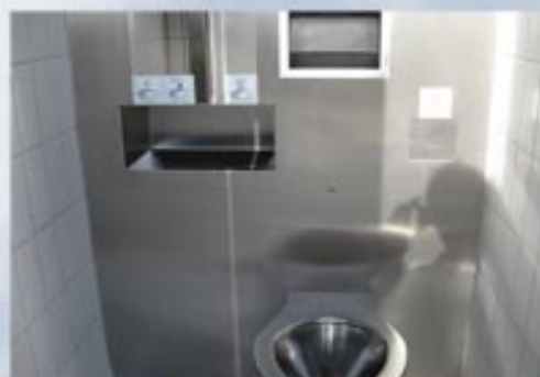
Siège à chasse automatique