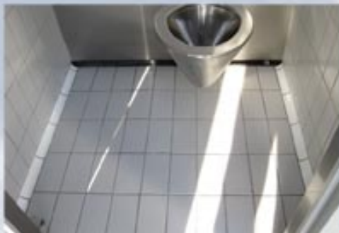
Carrelage toute hauteur