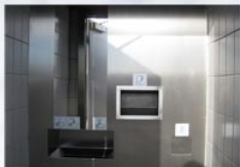
Lave-mains, poubelle, distributeur de papier

100 % recyclable certification ISO 14001