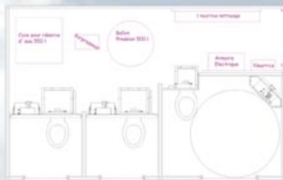
Préfabriqués de 3 à 6 toilettes.

Des millions d'utilisations 2000 toilettes en service